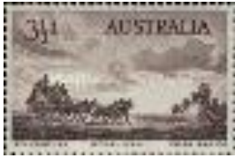
2 Australie 1953 Postkoets van de Royal Mail

mooi". (afb 2) De hele wereld werd verzameld en vooral die zegels van verre landen waren spannend! Hij kwam af en toe op de postzegelmarkt in Amsterdam en ging daarna altijd blij met nieuwe aanwinsten naar huis. Op een gegeven moment verloor hij als jonge man met een gezin in opbouw zijn interesse in het postzegels verzamelen. Zo'n 15 jaar later kwam