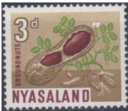
3 Nyasaland Leverancier van pinda's