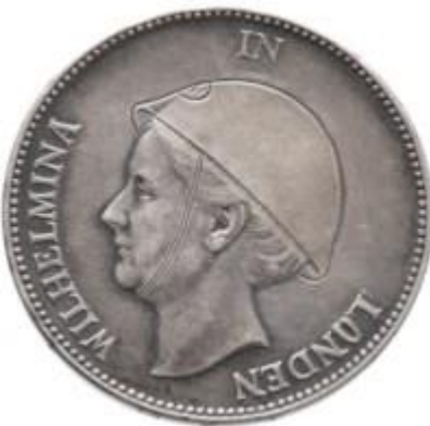
Originele 1 zilveren gulden 1940 Wilhelmina

Maar dan de munten. Met postzegels houd ik mij nu zestig jaar bezig en ik heb ervaren dat er nog heel veel is dat ik niet weet. En nu wilde ik proberen in zestig dagen kennis in munten en bankbiljetten op te bouwen. Gelukkig zijn er de nodige leerzame websites. En gelukkig kon ik terugvallen op enkele leden met kennis ter zake.