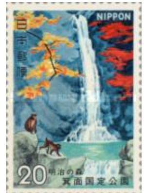
3 Japan 1973 Minoo Falls and Japanese Macaques