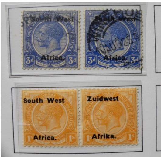
5 SWA Zuid West Afrika los en samenhangend

De cijfers m.b.t. de Spaanse griep van begin 1900 waarbij 45 van de 4250 inwoners van Assendelft omkwamen, vooral jonge kinderen en jong volwassenen, zijn dus duidelijk anders dan nu door het Covid19 virus het geval is. Nu sterven er vooral oudere mensen en in veel mindere mate jonge volwassenen of kinderen.