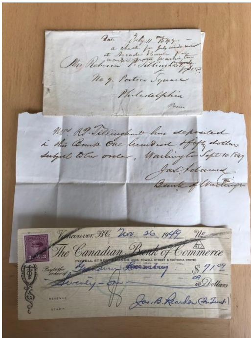
Figuur 1 Bovenaan de enveloppe waar de cheque van The Bank Of Washington uit 1847 in zat; Daaronder de genoemde cheque uit 1847 De onderste afbeelding is de Canadese cheque uit 1849