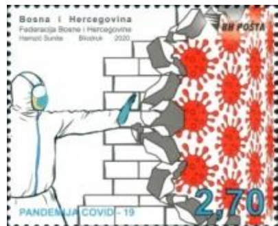
2 Bosnie Hercegovina 2020 Corona