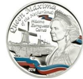
Officiële herdenkingsmunt Koningin Maxima

In de collectie zaten ook veel Euromunten van diverse landen en jaren en in allerlei kwaliteiten en jaarsets. Die euromunten doen mij denken aan onze euro-postzegels en de frankeerwaarden 1 en 2 vanaf 2010. Filatelisten hebben ervaren dat de postzegel als frankering voor een brief steeds verder aan kracht inboet. Wie schrijft er nog een brief? Wie ontvangt er nog een brief? Maar met munten is iets soortgelijks aan de hand. Zouden er nog leden van de Posthoorn zijn zonder pinpas? Toch maken muntenverzamelaars zich minder zorgen. De wereldprijs voor goud en zilver zorgt voor de stevige buffer onder de waarde van de munt. De huidige onzekerheden in de economische wereld maken dat de zilverprijs de laatste tijd zelfs de neiging heeft verder op te lopen.